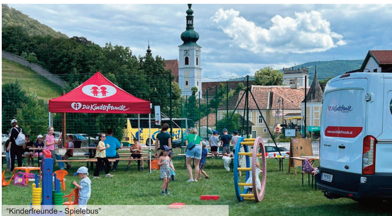
“Kinderfreunde - Spielebus”