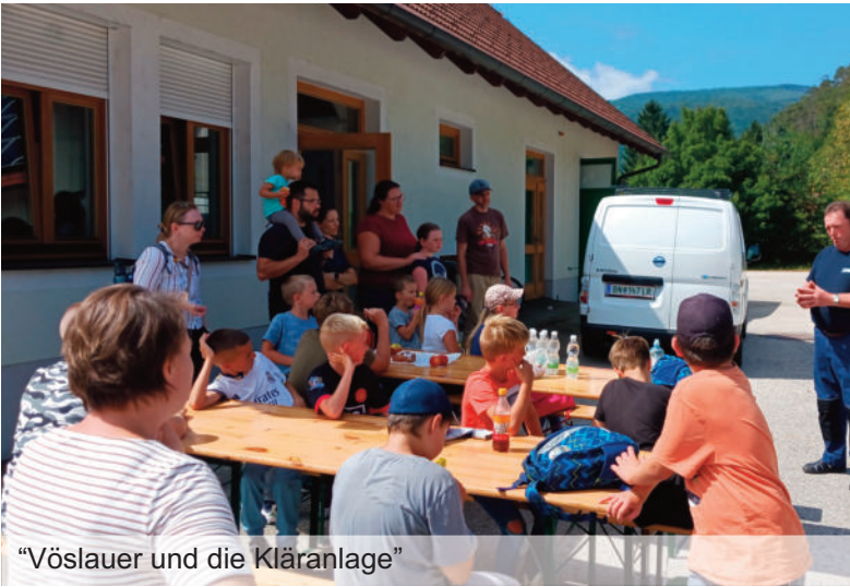
“Vöslauer und die Kläranlage”