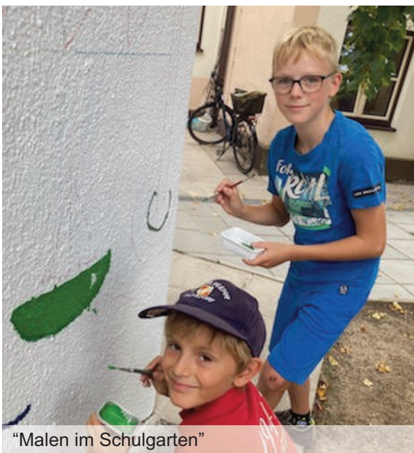
“Malen im Schulgarten”