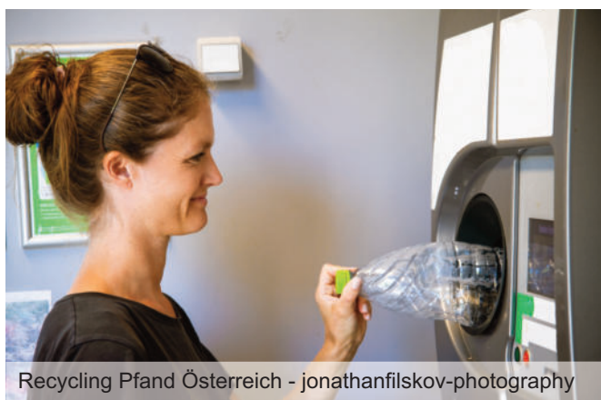
Recycling Pfand Österreich

02234/74151 abfallberatung@gvabaden.at www.gvabaden.at