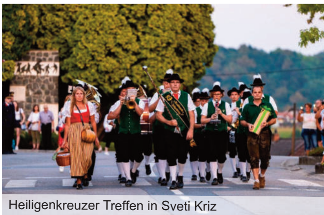
Heiligenkreuzer Treffen in Sveti Kriz

Nach der bereits traditionellen Prozession zur Lourdes-Grotte am 14. August besuchten wir am 24. August unsere Freunde im kroatischen Sveti Kriz, wo das heurige Heiligenkreuzer-Treffen stattfand.