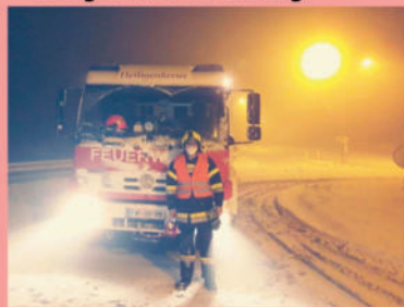
Schneeeinsatz A21 - hängengebliebene LKW