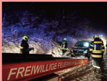
Verkehrsunfall LB 210