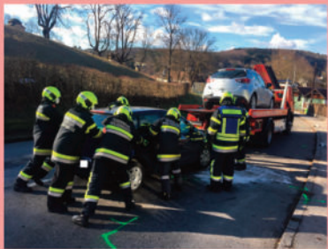
Verkehrsunfall im Ortsgebiet