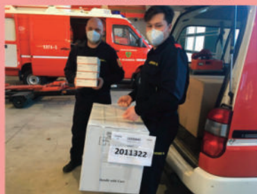
Unterstützung d. Gemeinde bei den Massentests